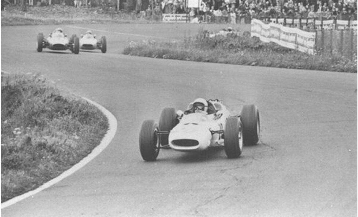
Ronnie Bucknum (RA271) en el Gran Premio de Alemania de 1964